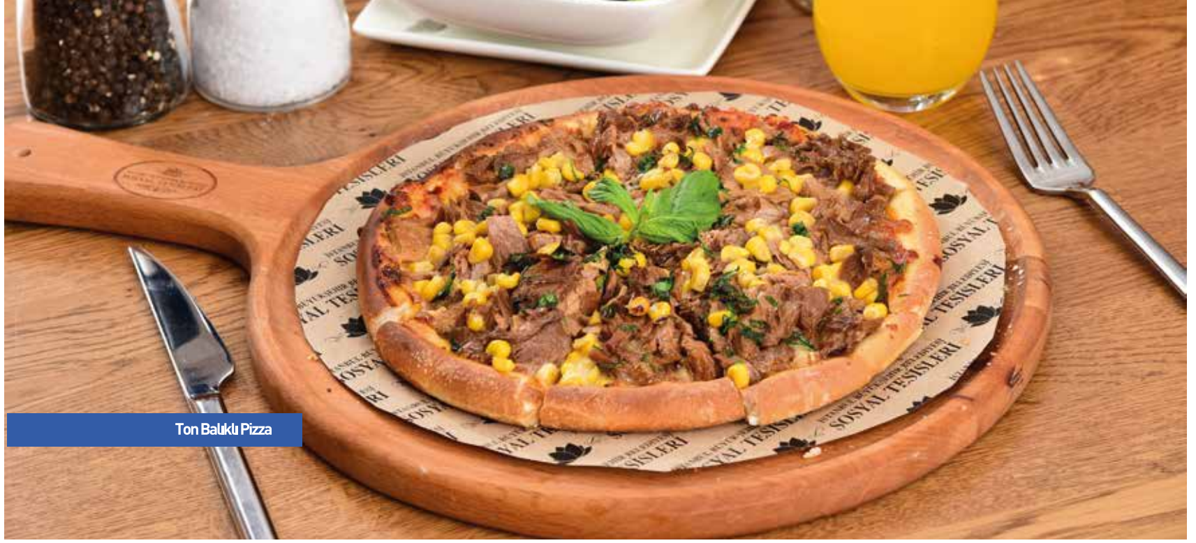
Ton Balıklı Pizza