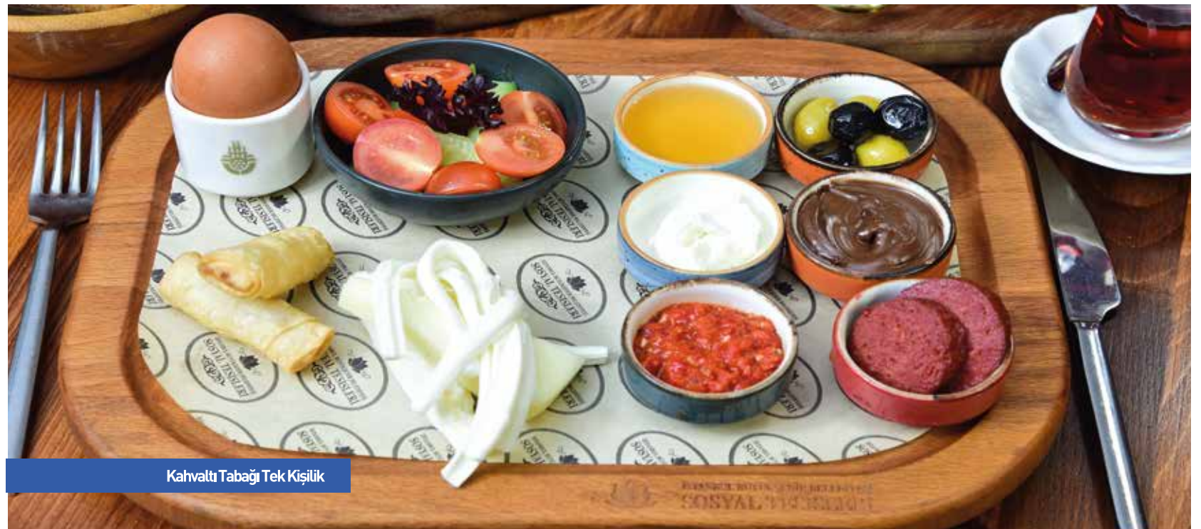
Kahvaltı Tabagı Tek Kişilik