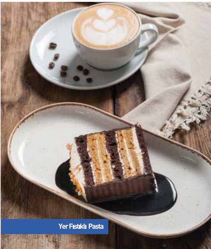
Yer Fıstıklı Pasta