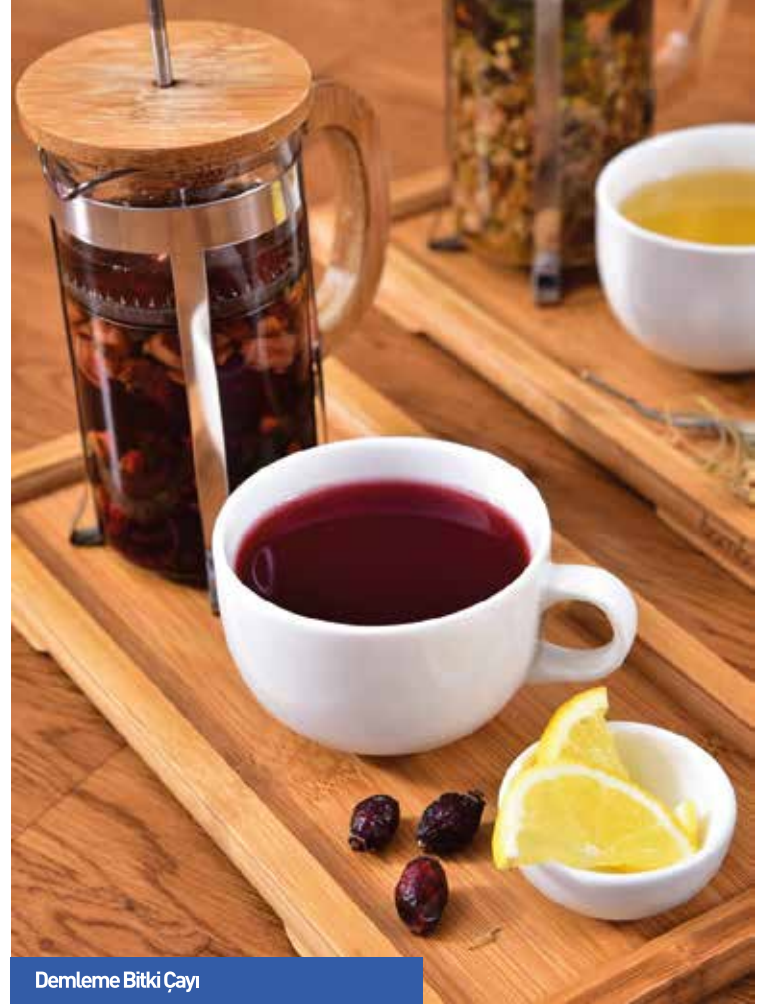
Demleme Bitki Çayı

Demleme Bitki Çayı / Brewed Herbal Tea .... 40 ₺